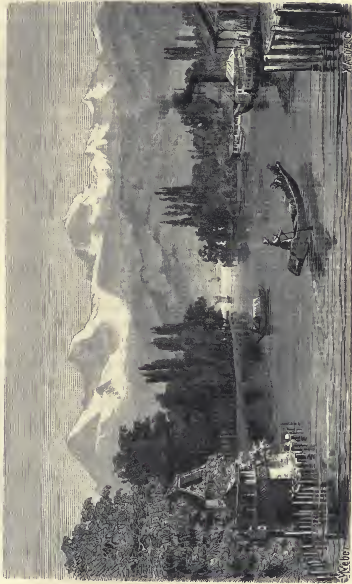
Städtische Wohnhaus auf der Karthage bei Tunis.